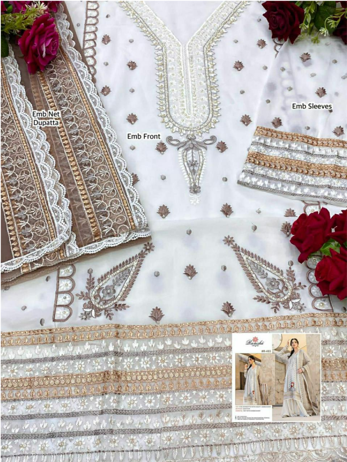
Emb Net Dupatta